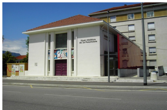
La Ponatière : 2 avenue Paul Vaillant Couturier, Échirolles

~ L'arrivée : prévoir l'arrivée de votre groupe une demie-heure avant le lever de rideau. Le référent du groupe est invité à récupérer les places auprès de la billetterie et à distribuer un billet à chaque élève avant l'entrée en salle. Une personne de l'équipe d'accueil vous orientera et vous rappellera les éléments à ne pas oublier avant de rentrer en salle.