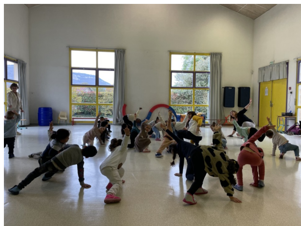
Atelier de danse avec la compagnie Lamento dans le cadre du sentier « Petits Rebonds », à destination d'une classe de MS de l'école Françoise Dolto

Convaincue par l'importance de l'éducation par l'art, chaque saison, l'équipe travaille pour vous accompagner dans votre projet et permettre aux élèves un accès réussi au spectacle vivant. En participant à la vie artistique et culturelle, chaque jeune éveille et développe sa créativité, son esprit critique et sa sensibilité. Par ce biais, il contribue à se former et à s'émanciper en tant que personne et citoyen. Pour atteindre ces objectifs ambitieux, les actions portées par La Rampe-La Ponatière s'appuient sur les trois piliers qui fondent l'Éducation Artistique et Culturelle : la rencontre avec les œuvres, la découverte d'une pratique artistique et l'appropriation des connaissances. Elle porte également une attention toute particulière à la nécessité d'une approche globale intégrant tous les temps du jeune, rayonnant ainsi jusque dans la sphère familiale et amicale.