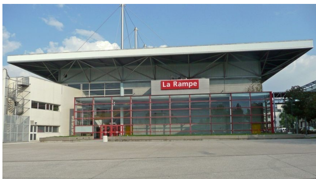
La Rampe : 15 avenue du 8 mai 1945, Échirolles

~ Le lieu de rendez-vous : La Rampe ou La Ponatière ? Les spectacles se déroulent dans l'une de ces deux salles : pensez à vérifier en amont le lieu de la représentation à laquelle vous allez assister.