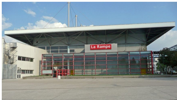
La Rampe : 15 avenue du 8 mai 1945, 38130 Échirolles

~ Le lieu de rendez-vous : La Rampe ou La Ponatière ? Les spectacles se déroulent dans l'une de ces deux salles : pensez à vérifier en amont le lieu de la représentation à laquelle vous allez assister.