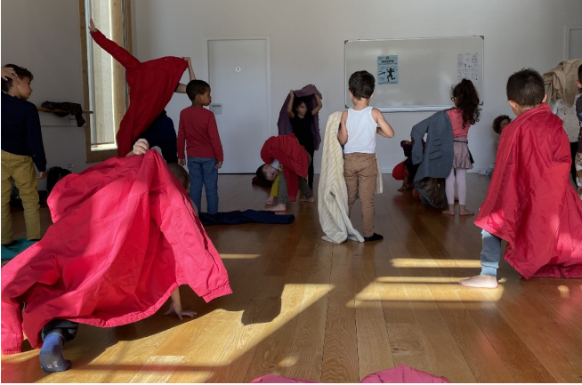
Atelier de danse avec la Cie Sur le Tas et les élèves de l'école maternelle Auguste Delaune